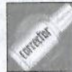
Bombe niveau 3